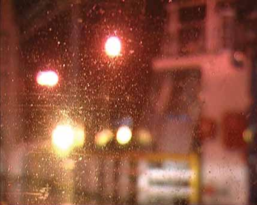
3- Nooshin Farhid, Criss Cross (2009), still from video.

۳- نوشین فرهید، خطاطی (۱۳۸۸)، تصویری از ویدیو.